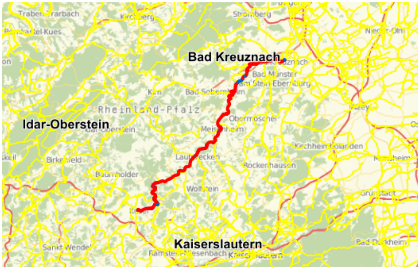
Maßstab 1 : 79737